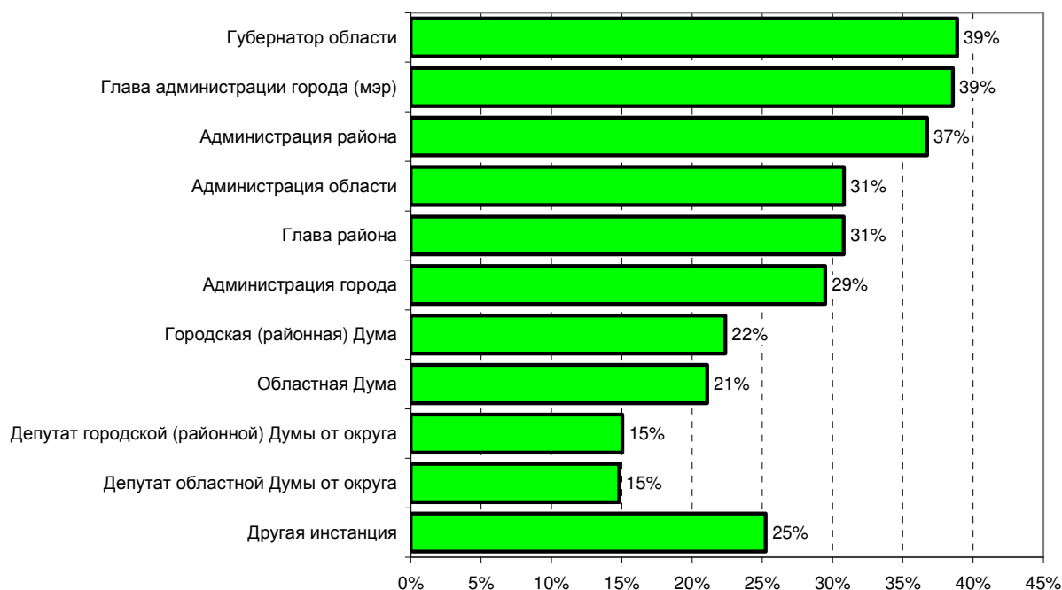
Рис. 3. Распределение ответов респондентов на вопрос об инстанциях, ответственных за решение наиболее актуальных проблем

Анализ актуальности социально–экономических проблем позволяет сделать следующие выводы: